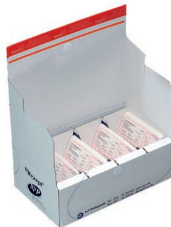
Stabile, blickdichte AvP-Rezeptbox