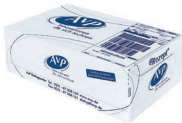
AvP-Rezeptbox mit integriertem Lieferschein